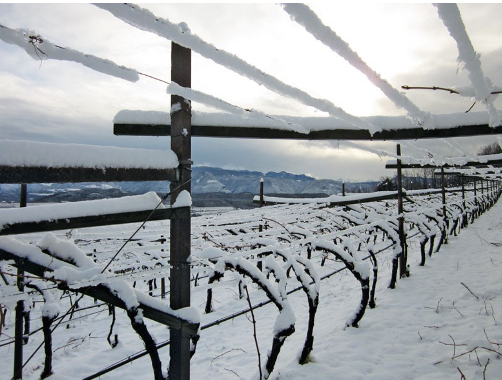
Sehr winterlich verliefen die letzten Wochen des Jahres 2017.

nerischen Herbstbeginn im September zeigten sich Oktober und November sehr sonnig und warm, mit relativ kühlen Nachttemperaturen, welche der Ausbildung der Deckfarbe bei zweifarbigem Apfelsorten sicherlich recht förderlich waren. Die Niederschläge erreichten, bedingt vor allem durch den extrem trockenen Oktober, nur etwas mehr als die Hälfte der sonst üblichen Mengen. Die Apfelernte, vor allem jene der spätreifenden Sorten, konnte 2017 oftmals bei