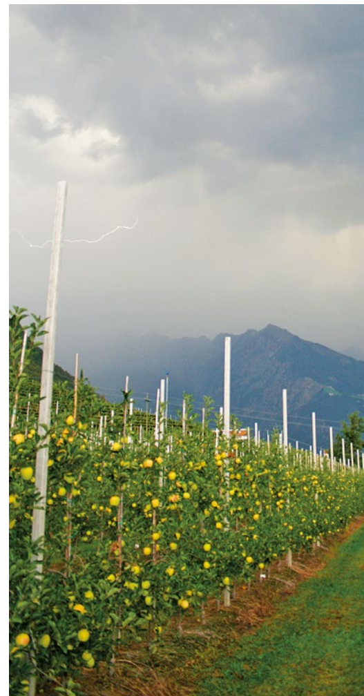
Gewitterreicher Sommer 2017.

Ähnlich wie der Juni verlief auch der Juli dieses Jahr sehr sonnig und warm. Die Monatsdurchschnittstemperatur lag gleich wie im Vorjahr bei 23,1 °C und damit etwas über dem langjährigen Bezugswert von 22,3 °C. Täglich stieg die Quecksilbersäule über 25 °C, somit wurden heuer 31 Sommertage und zudem 21 Tropentage registriert. Im langjährigen Schnitt werden für diesen Monat 27 Som-